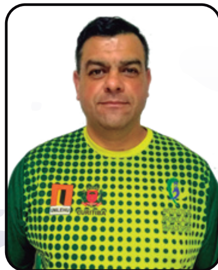
Vôlei - Atacante