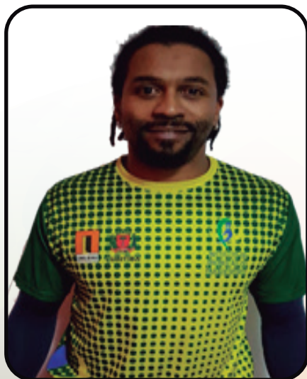
Vôlei - Atacante